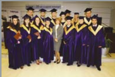
Выпускники, успешно выполнившие программу, получают: