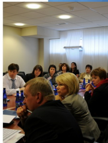
Участия Круглого Стола «HR и IPO»